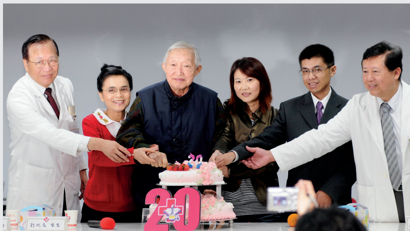
圖4. 換心超過20年記者會，辛勤耕耘終於成功開心收割。