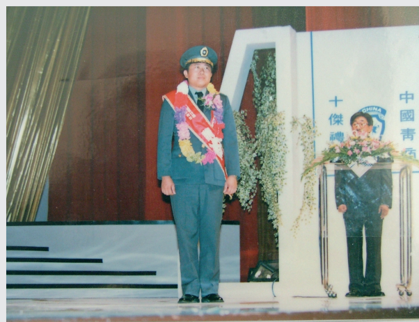
民國79年39歲的年輕軍醫-成功開心教授，被推薦為第28屆十大傑出青年，實至名歸。