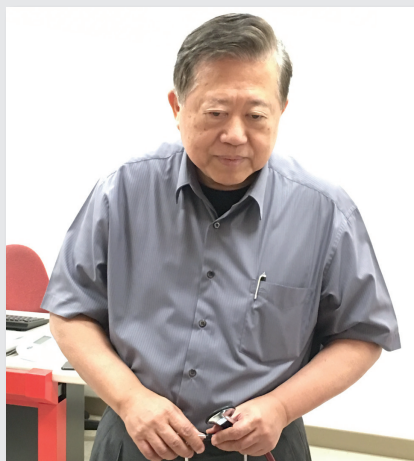
圖3. 沈思專注的魏崢常說：成功的外科醫師要有良好的體力、耐力與一顆恆久不變的愛心。

心臟病為國人十大死因第三位，也是一種常見的循環系統疾病，一般高發病人群為中老年人，大致可為：冠狀動脈粥樣硬化性心臟病、高血壓性心臟病、風濕性心臟瓣膜病、肺源性心臟病、風濕性心臟病、先天性心臟病等，其中由抽菸、糖尿病、高血壓等