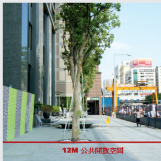
圖6. 建築退縮12公尺開放市民使用