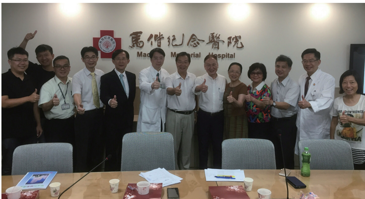
台灣國際安全醫院學會理、監事會在馬偕紀念醫院舉行，馬偕醫院院長親自參加。大家共同為圓滿完成任務而慶祝！