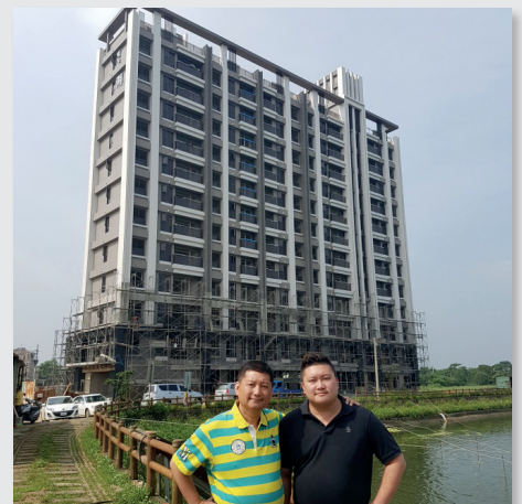
圖6. 父子用心經營打造好宅