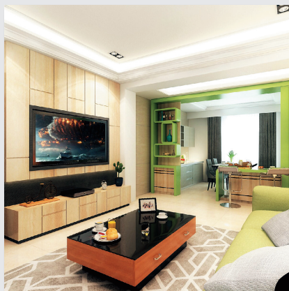
圖8. 錢都8.9期三房客廳示意圖