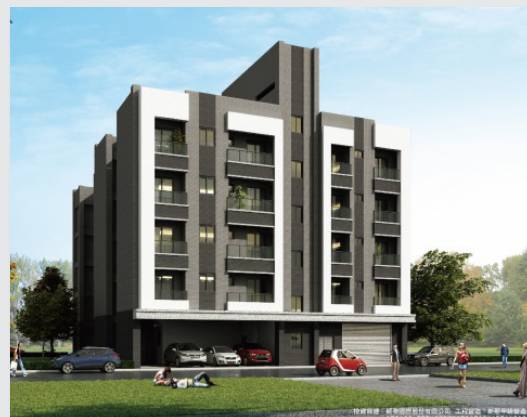
圖9. 威泰錢都8期3D外觀圖