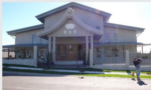
圖2. 澳洲黃金海岸靜思堂