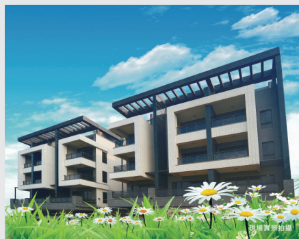
圖11. 墅JIA - 外觀實景圖