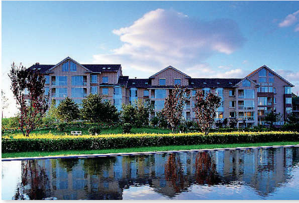
北京 奧林匹克花園（一期）