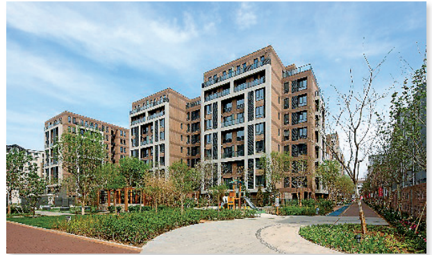
北京 雅世·合金公寓