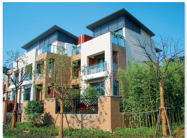
上海 沿海·麗水馨庭（一期）