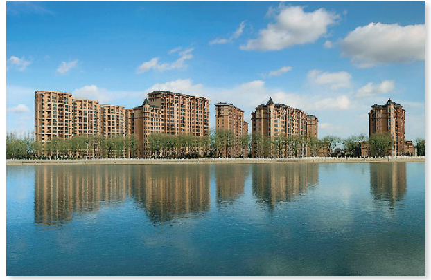
呼和浩特 東岸國際 A 區