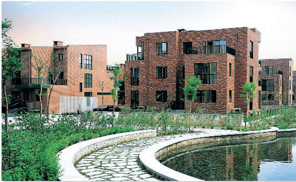
北京 金地·格林小鎮