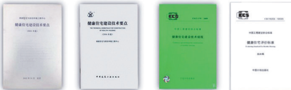
《健康住宅建設技術要點》(2001年版) 《健康住宅建設技術要點》(2004年版) 《健康住宅建設技術規程》(CECS179:2009) 《健康住宅評價標準》(2016年版)